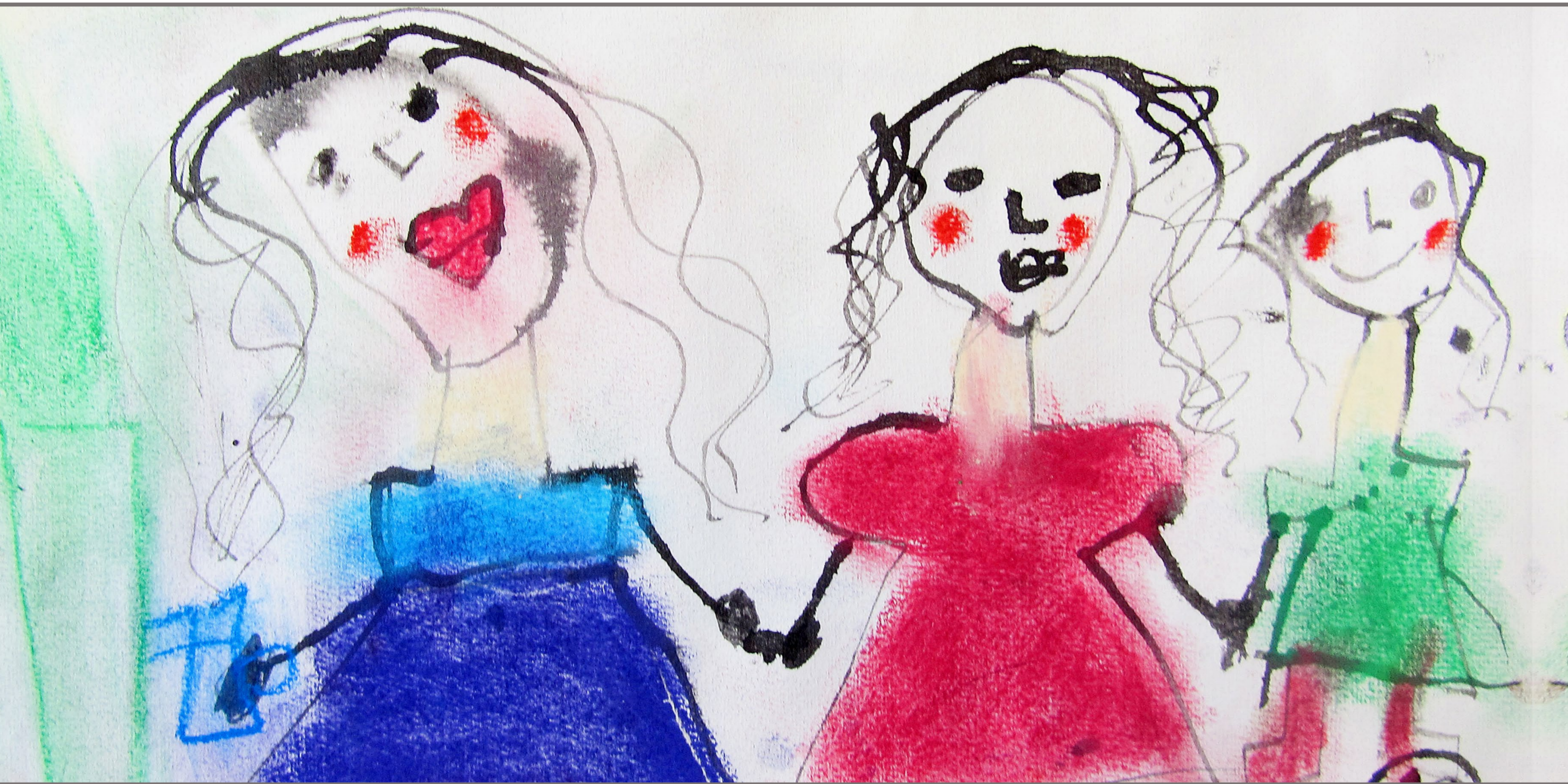
Bild: Victory (6 Jahre), gemalt im MAL MIR MAL – Atelier des Paritätischen Kindergartens

ORIENTIERUNG IN UNÜBERSICHTLICHEN ZEITEN